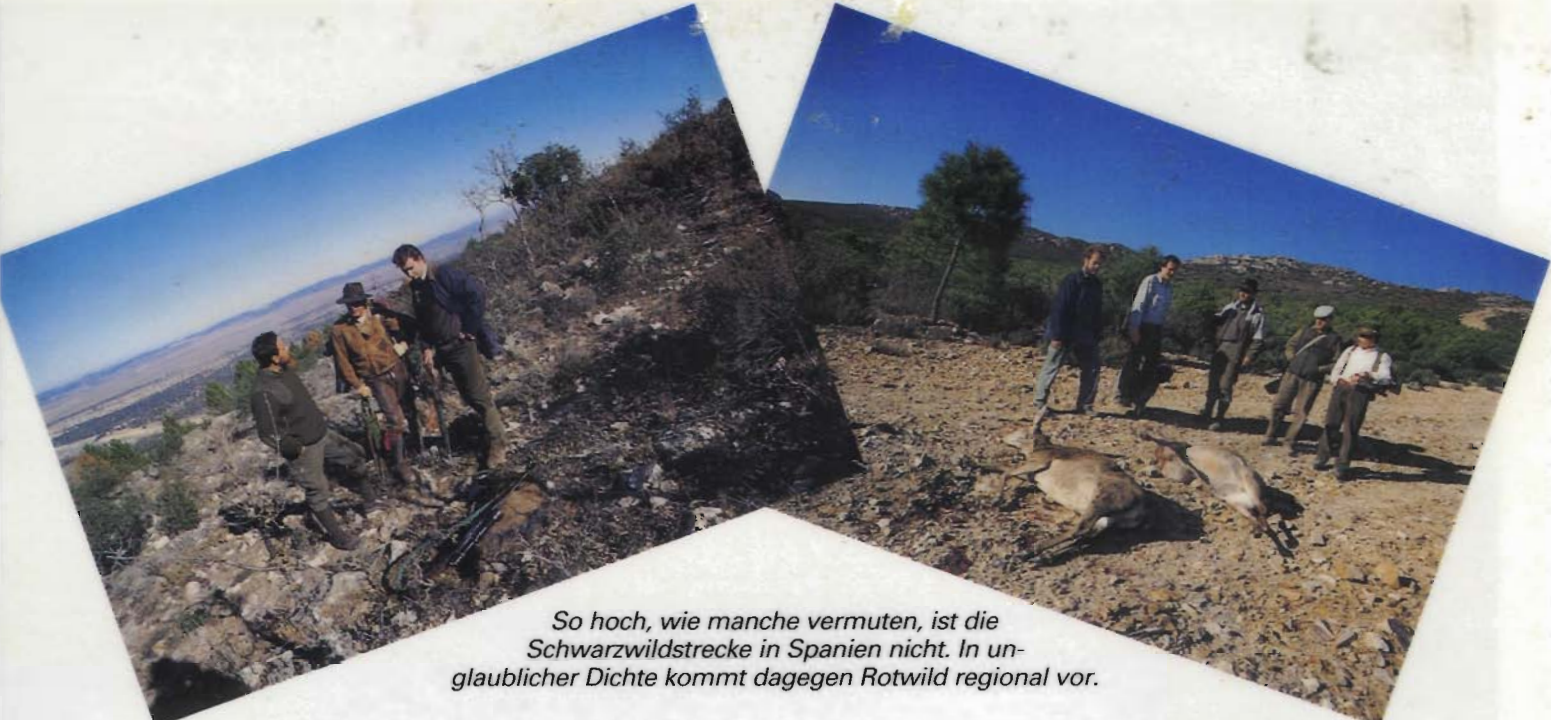
So hoch, wie manche vermuten, ist die Schwarzwildstrecke in Spanien nicht. In unglaublicher Dichte kommt dagegen Rotwild regional vor.

Jägern kein Problem. Wild gibt es ja genug.