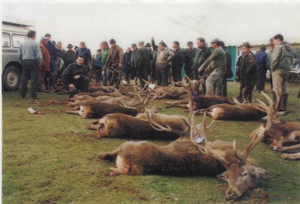
Die Hirsche in Spanien werden vom Geweihgewicht nicht allzu schwer, dafür sind die Trophäen oft endenreich. Ein Zusatzhirsch ohne Begrenzung kostet nur 1100 Mark.

Vollverpflegung; • Dolmetscher deutsch – englisch; • Treibjagd auf Rothühner; • Vermittlungsgebühr, alle Reiseunterlagen.