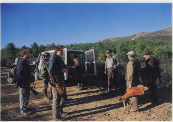
Aufbruch zur Kahlwild-Monteria. In Spanien muß das Gewehr bis zum Stand in einem Futteral verschlossen sein, also dünne Tragehülle mitnehmen.

Auf der Jagd selbst bricht voll das spanische Temperament durch, es wird geschossen, weil es Freude macht, Beute zu machen. Immerhin liegen bei 18 Schützen 26 Hirsche und ein halbes Dutzend Sauen auf der Strecke. Die Geweihe werden nicht viel schwerer als fünf bis sechs Kilo, sind aber teilweise sehr enden-