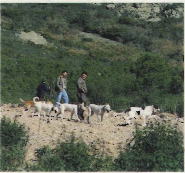
Profis bei der Arbeit: Oft über 200 Hunde und viele Dutzend Treiber durchkämmen die dicht bewaldeten oder mit Buschwerk überzogenen Hänge.

Die nachlassende Konzentration wird immer wieder durch Schüsse „aufgemüdet“. Plötzlich steinelt es, Kahlwild quert die 40 Meter breite, steinige Schneise. Im Schuß des Nachbarn rolliert ein Alttier. Unmittelbar darauf kommen die Hunde, einige mit Glöckchen, bewinden kurz das Tier – und weiter geht's. Echte Profis, diese großen, braun-weißen Meutehunde. Viele, viele Schüsse fallen.